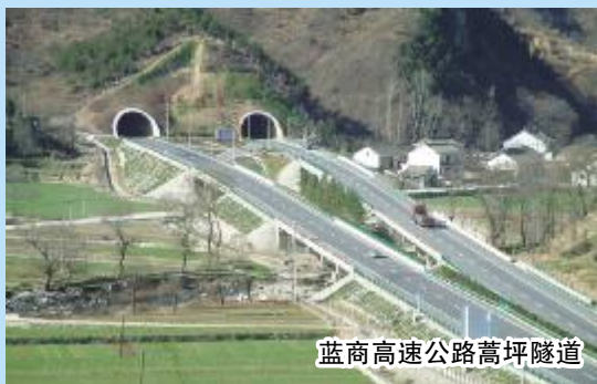
蓝商高速公路蒿坪隧道