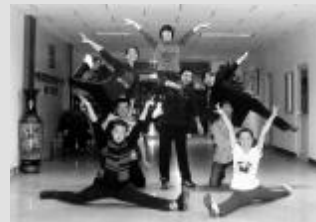
瞧!这支文艺宣传队

▲为了丰富职工业余文化生活,加强职工精神文明建设,中建保华公司内蒙古分公司团委于近日成立了文艺宣传队。文艺宣传队分设舞蹈队、声乐队、模特队、宣传队等。图为舞蹈队队员正在迎接新年晚会紧锣密鼓地排练。