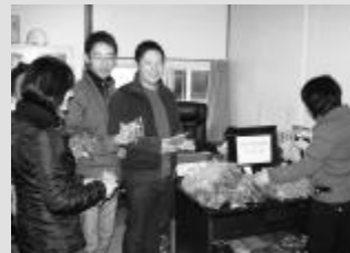
嘻!哎呀妈呀,我到家了!

▲近日,全国大部分地区普遍降温,宁波更是出现连日阴雨湿冷天气,局上海分公司宁波江北万达项目领导心系员工,为确保广大员工的身体健康,想职工所想,急职工之急,紧急采购一批防寒棉衣、防流感药物,并派发到员工手中,一位领到棉衣和药物的员工幽默地引用了小沈阳的话:哎呀妈呀,我到家了!