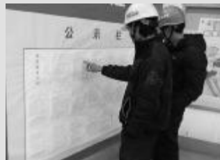
好!宪法教育进工地

▲12月1日,局上海分公司法律事务室通过宪法宣传专刊、学习园地、法务咨询、法律培训等形式,在各项目开展了为期一周的宪法宣传教育活动。