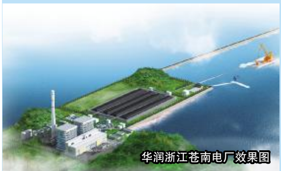
华润浙江苍南电厂效果图

面对取得的成绩,土木公司党委不骄不躁,以“各项工作争一流”为目标,正以奋发向上、励精图治的创新精神阔步迈向充满挑战与机遇的2010年。