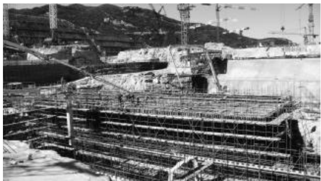
▲7月3日，台山核电站常规岛2#主厂房汽机基座筏基替代混凝土浇筑完成。2#主厂房汽机基座筏基替代混凝土的浇筑，从7月1日开始分两次完成，共浇筑混凝土3400多立方米，为下一步汽机基础筏基的正式施工奠定了基础。