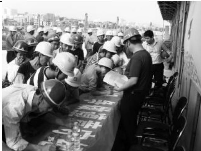
▲5月11日，二公司深圳分公司泉州中芸洲十一组团项目部组织管理人员、外联队职工百余人进行“安康杯”启动仪式暨签名活动。

为资产管理核算单位，可提供同规格、同栋数的转换。如果项目承接比较集中，添置量较多时，可以短期租借的形式先行透支，待项目结束拆回后返还，以避免在项目减少时出现活动板房过剩、闲置的情况。对使用过的活动板房提供专业免费翻新、仓储服务。活动板房周转六年后，雅致公司以原值的20%进行回购。（崔东升）